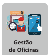
Gestão de Oficinas