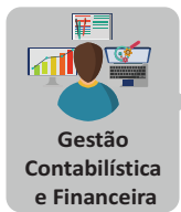
Gestão Contabilística e Financeira