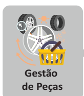
Gestão de Peças