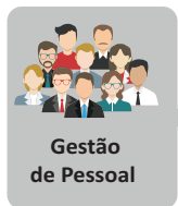
Gestão de Pessoal